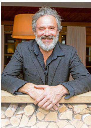
Mit der Stimme des Schauspielers Gian Rupf.

Wir wünschen viel Vergnügen und spannende Momente!